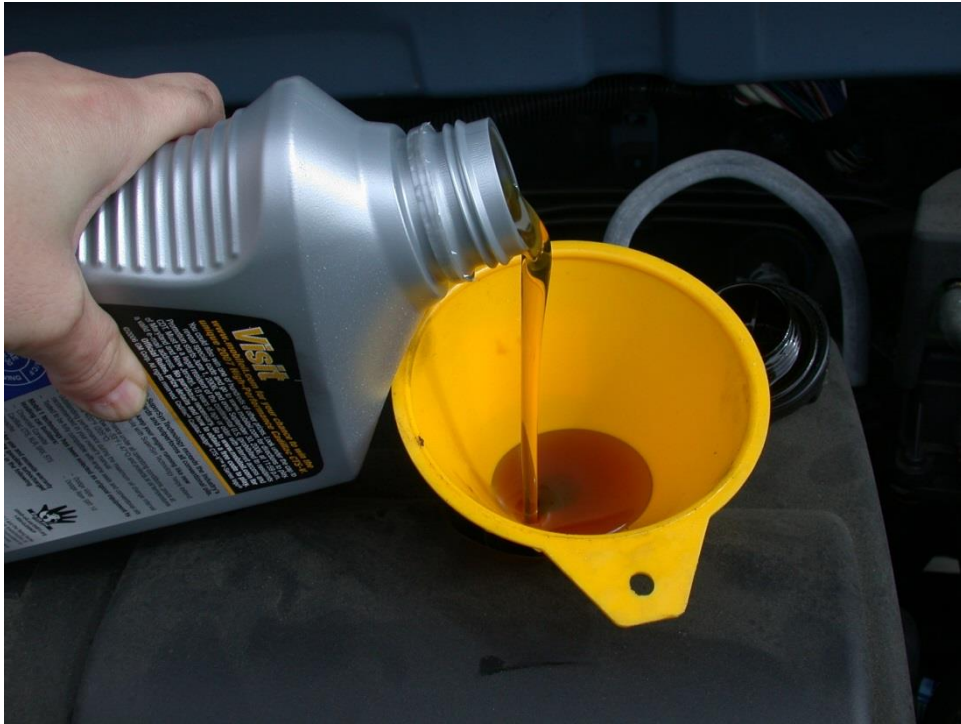
Imagen de Dvortygirl - Trabajo propio, CC BY-SA 3.0, https://commons.wikimedia.org/w/index.php?curid=2584787