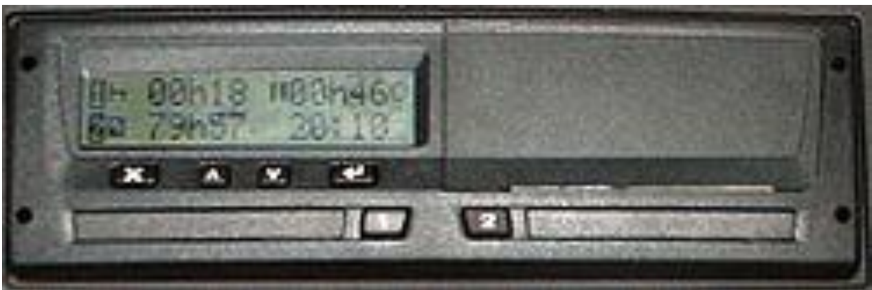
Obr. 7 Digitálny tachograf

Po vložení karty do tachografu sa zobrazí načítavanie karty, pričom načítavanie sa preruší otázkou „M zadat Dodatok?“ s možnosťou voľby áno a nie. Ide o možnosť zadania manuálneho dodatku, to znamená činností, ktoré vodič vykonával mimo vozidla. Ak by vodič vykonával jazdu s digitálnym tachografom, pri načítavaní karty by mal postupovať nasledovne: