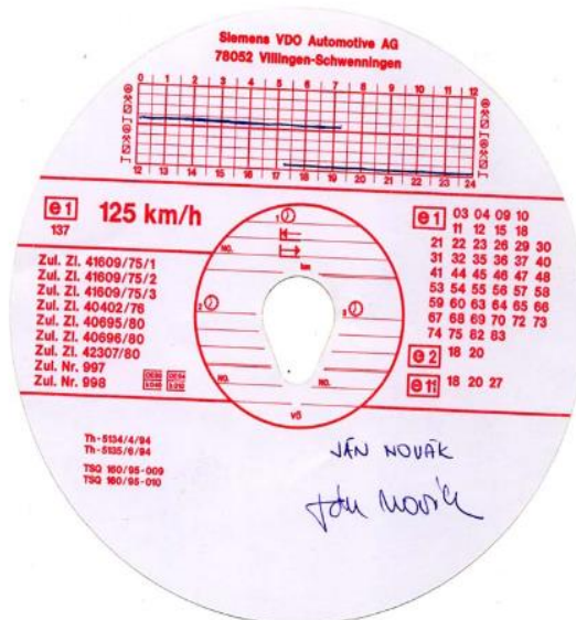
Obr. 2 - Denný čas odpočinku uvedený na zadnej strane kotúča za deň 8. 4. 2010

Tachografový kotúč nenecháva vo vozidle, pretože nie je jasné, o koľkej ráno bude preberať vozidlo (aby v tachografe kotúč neostával dlhšie ako 24 hodín) a tiež nie je jasné, či ďalší deň bude vykonávať s tým istým vozidlom. To znamená, vodič prvý deň ak ukončil prácu s vozidlom v čase 17,15 h, musí vybrať kotúč z tachografu a štandardne ukončiť záznamy na kotúči, to znamená uvedie (obr. 1): miesto vybratia kotúča (Revúca), dátum vybratia kotúča (8. 4. 2010), stav počítadla vzdialenosti pri vybratí kotúča (234 436 km) a vypočíta vzdialenosť ubehnutú s vozidlom na kotúči (323 km)