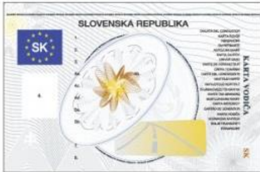
Obr. 6 Tachografová karta vodiča

Pri jazde s vozidlom vybaveným digitálnym tachografom, sa pravidelný odpočinok preukazuje manuálnym zadávaním údajov pri načítavaní tachografovej karty vodiča. Pri ukončení zmeny, ak vodič nečerpá odpočinok vo vozidle, by mal kartu vodiča vybrať z tachografu (pri odhlasovaní zadať krajinu prízjazdu) a kartu si zobrať so sebou domov.