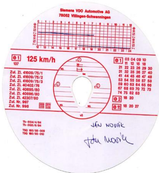
Obr. 2 - Denný čas odpočinku uvedený na zadnej strane kotúča za deň 8. 4. 2010

Tachografový kotúč nenecháva vo vozidle, pretože nie je jasné, o koľkej ráno bude preberať vozidlo (aby v tachografe kotúč neostával dlhšie ako 24 hodín) a tiež nie je jasné, či ďalší deň bude vykonávať s tým istým vozidlom. To znamená, vodič prvý deň ak ukončil prácu s vozidlom v čase 17,15 h, musí vybrať kotúč z tachografu a štandardne ukončiť záznamy na kotúči, to znamená uvedie (obr. 1): miesto vybratia kotúča (Revúca), dátum vybratia kotúča (8. 4. 2010), stav počítadla vzdialenosti pri vybratí kotúča (234 436 km) a vypočíta vzdialenosť ubehnutú s vozidlom na kotúči (323 km).