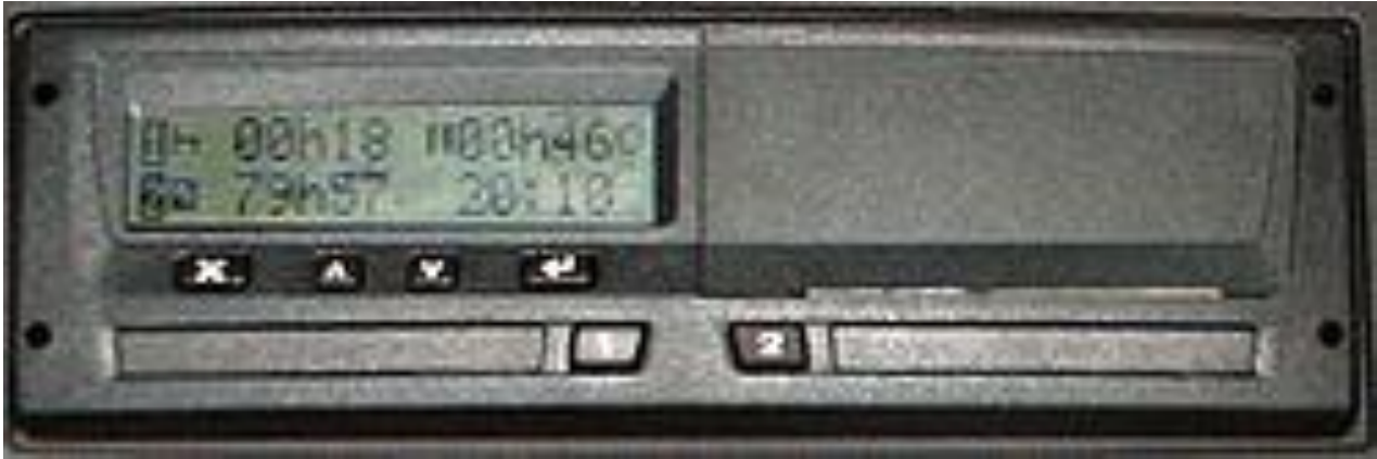
Obr. 7 Digitálny tachograf

Po vložení karty do tachografu sa zobrazí načítavanie karty, pričom načítavanie sa preruší otázkou „ M zadat Dodatok? “ s možnosťou voľby áno a nie. Ide o možnosť zadania manuálneho dodatku, to znamená činností, ktoré vodič vykonával mimo vozidla. Ak by vodič vykonával jazdu s digitálnym tachografom, pri načítavaní karty by mal postupovať nasledovne: