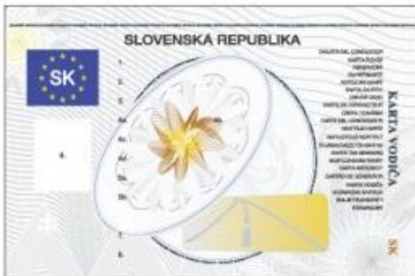
Obr. 6 Tachografová karta vodiča

Pri jazde s vozidlom vybaveným digitálnym tachografom, sa pravidelný odpočinok preukazuje manuálnym zadávaním údajov pri načítavaní tachografovej karty vodiča. Pri ukončení zmeny, ak vodič nečerpá odpočinok vo vozidle, by mal kartu vodiča vybrať z tachografu (pri odhlasovaní zadať krajinu príjazdu) a kartu si zobrať so sebou domov.