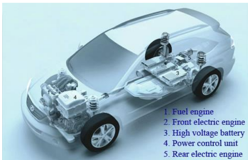
Obrázok z projektu DRMA20. Španielsko